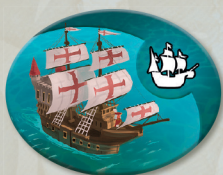
• 1 Karawela