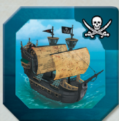
• 12 Statków Pirackich

Do rozgrywki z tym rozszerzeniem będziesz również potrzebować poniższych elementów z podstawowej gry Small World : Sztandarów ras, Oznak zdolności specjalnych, znaczników, monet zwycięstwa i kości posiłków.