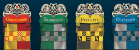
Vlagtegels (4 verschillende soorten)