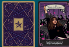
Word de Favoriet-kaart