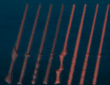
Toverstokken (8 verschillende)