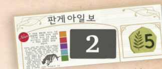
Středně velký žeton novinek

Kompletní sada druhu nesmí mít více než tři karty, zatímco kompletní sada velikosti nesmí mít více než pět karet. Pokud jste prvním hráčem, který určitý druh sady dokončil, odpovídající žeton novinek vám už nemůže být ukraden.