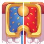
Città di Nuvole