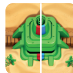
Campo di Battaglia