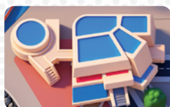
Niebieska kwatera główna