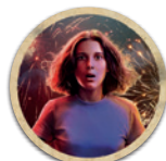
Lato In Gioco