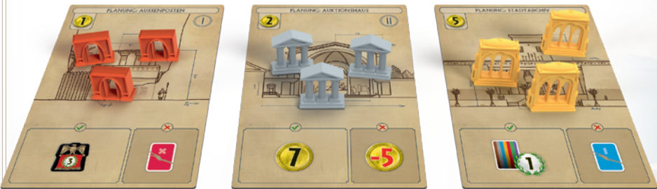
Spielvorbereitung im Spiel zu fünf