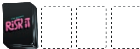
Mazzetto di 16 carte

Mescolate tutte le carte ed estraetene 16 per formare un mazzetto a faccia in giù. Collocate questo mazzetto al centro del tavolo. L'area di gioco dovrebbe apparire così: