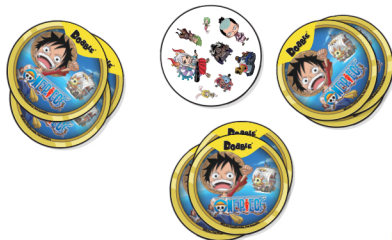
Preparazione: Esempio per 3 Giocatori

4) Vincere il Gioco: Il primo giocatore a sbarazzarsi di tutte le proprie carte vince.