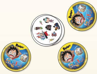
Preparazione: Esempio per 3 Giocatori

4) Vincere il Gioco: Il giocatore con più carte vince.