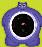
Gatto Buco Nero