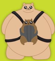
Gatto nel Sacco