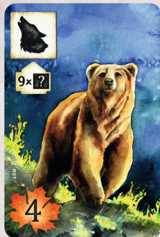
R01 Orso bruno

Per poter giocare questa carta nella tua area prato, hai bisogno di almeno 9 carte terreno. La carta può essere giocata su una qualsiasi di esse (seguendo le regole standard).