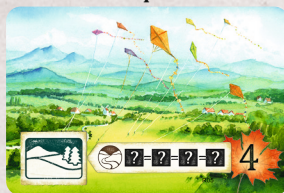
R05 Paesaggio con aquiloni

Per poter giocare questa carta nella tua area circostante, devi avere almeno 4 carte terreno con lo stesso simbolo.