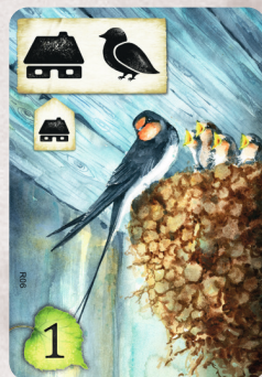
R06 Nido di uccelli sotto il tetto

Per poter giocare questa carta su una carta panorama precedentemente giocata, hai bisogno di almeno 5 simboli panorama nella tua area circostante (e almeno un simbolo panorama deve essere visibile per giocare la carta scoperta).