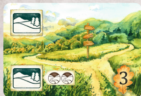
R04 Paesaggio con biforcazione stradale

Per poter giocare questa carta nella tua area circostante devi avere 2 tessere strada inutilizzate. Quando giochi questa carta, colloca entrambe le tessere strada al di sotto di essa e gira le tessere, in modo che il lato senza il simbolo strada sia visibile. Questa carta fornisce 2 simboli panorama che consentono di giocare 2 carte scoperte su di essa (vedi esempio 1).