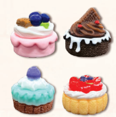
Tartas × 32

(la forma y el color no tienen ningún efecto en el desarrollo de la partida)