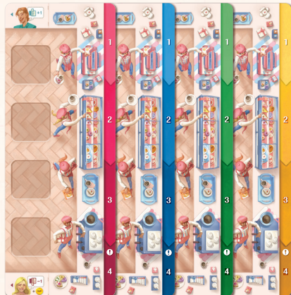
Tableros individuales × 4

(reemplazad los tableros individuales del juego básico)