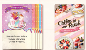
Cartas de Tarta × 60

(la forma y el color no tienen ningún efecto en el desarrollo de la partida)