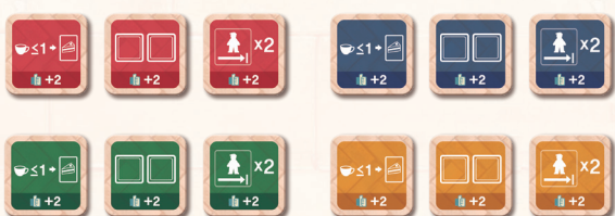
Fichas de Mejora × 12

(ahora podéis elegir cualquiera de los colores en partidas de 2 jugadores)