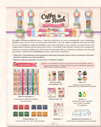
Reglamento × 1

(3 de cada color: rojo, azul, verde y amarillo)