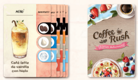
Cartas de Pedido de la expansión × 30

(reemplazad los tableros individuales del juego básico)