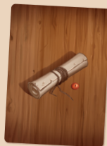
Carta de Evento