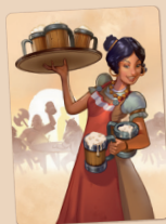
Carta de Personaje

En vuestro turno, robad una carta del montón. Esta puede ser una carta de Personaje o una carta de Evento.