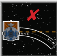
Deslizamiento [2 ↵] incorrecto