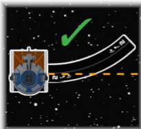
Deslizamiento [2 ↵] correcto