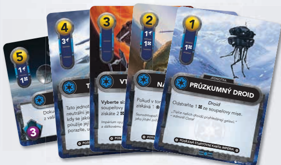
Vylepšené startovní karty Impéria