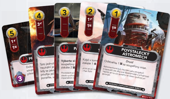
Vylepšené startovní karty povstalců

Vylepšené startovní karty se snadno poznají podle černého označení ve spodní části.