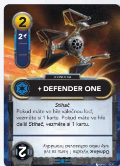
Rámeček karty posil