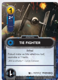
Rámeček původní karty

Karty posil lze snadno poznat podle zlatého rámečku kolem jména karty.